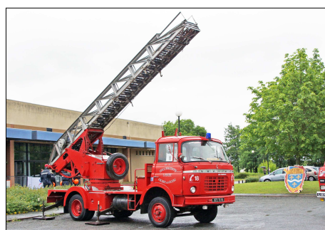
179 SP – MALESHERBES (45) Echelle Pivotante Semi-Automatique Berliet GAK © Francis BOURY - 2012.