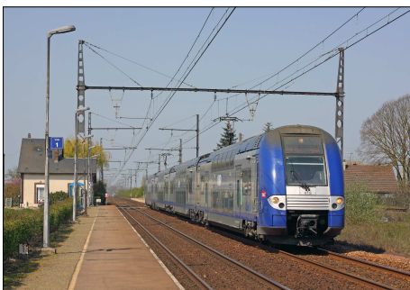
851 CF – AMILLY-OUERRAY (28) Automotrice Z 26529/530 © Laurent THOMAS - 2010.