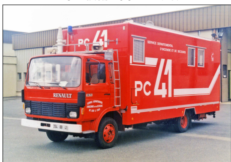
177 SP – BLOIS (41) Poste de Commandement Toutencamion sur Renault JK 75.