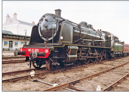
861 CF – CHINON (37) Locomotive « Mikado Etat » 141 C 100