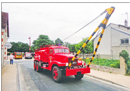
172 SP – CHABRIS (36) Camion Citerne feux de Forêt Lourd Froger © Michel CAYRE - 2022.