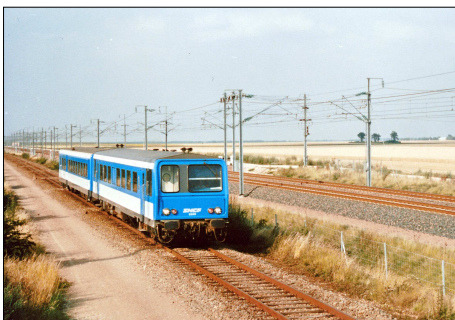
854 CF – SAINT-LEGER-DES-AUBEEES (28) Autorail X 2209 avec une XR 6100 se dirige vers Voves.