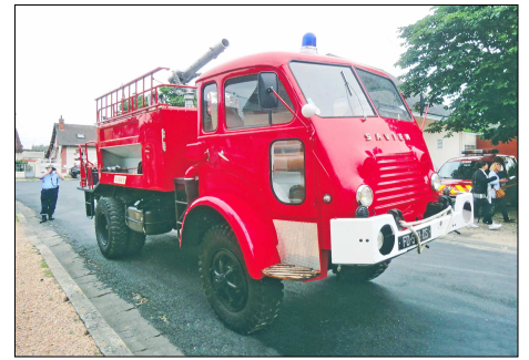
182 SP – CHABRIS (36) Véhicule Mousse Aéronautique Sides Renault Tancarville.

Série "Sapeurs-Pompiers" : 18 CP franco de port: 22 € (France), 26 € (étranger)