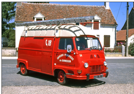
165 SP – BANNEGON (18) Véhicule Tous Usages Renault Estafette.