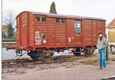
14 PR – SALBRIS (41) Un ferroviathe pose devant cet ancien couvert OCEM 19

IBAN : FR76 1548 9048 0300 0655 8030 486