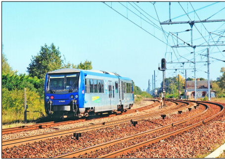
863 CF – GIEVRES (41) Autorail X 74502 repart vers Romorantin.