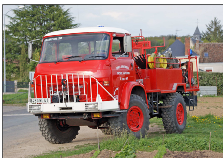
178 SP – VILLIERS-SUR-LOIR (41) Camion Citerne feu de Forêt Moyen Camiva sur Saviem SP 5. © Francis BOURY - 2009.