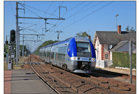
865 CF – GIEVRES (41) Automotrice Z 27835/836 en gare.