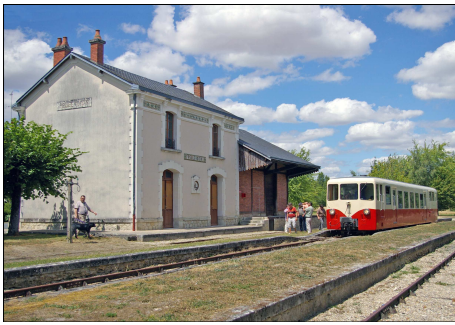
857 CF – PELLEVOISIN (36) Autorail Verney X 224 en partance pour Argy.