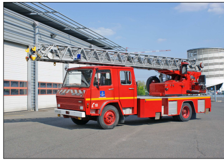
181 SP – ORLEANS (45) Echelle Pivotante Automatique Camiva sur Berliet 770 KB.