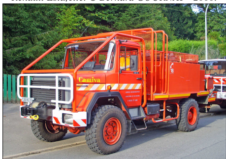
168 SP – BONNEVAL (28) Camion Citerne feux de Forêt Lourd Camiva sur Iveco 120.16