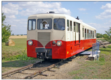
858 CF – ARGY (36) Autorail Verney X 224 quittant la gare.