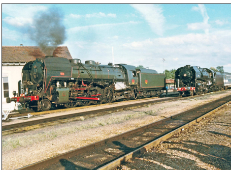
869 CF – MONTARGIS (45) Les 141 R 420 et 1207 au dépôt.