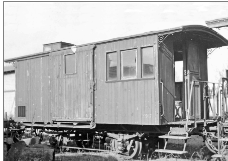
849 CF – LAUGERE (18) Ligne de Bourges à Laugère. Fourgon mixte n° 917. © Maurice RIFAULT - 1951.