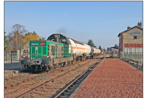
850 CF – AUBIGNY-SUR-NERE (18) Train de citernes de gaz tracté par la BB 69216 en gare