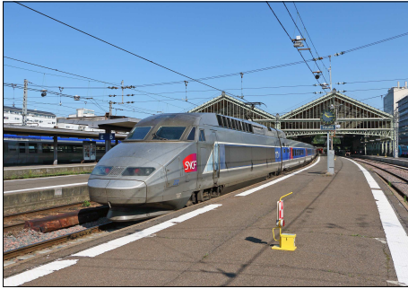
860 CF – TOURS (37) Le TGV Atlantique n° 372 en gare.