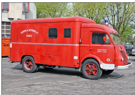
174 SP – TOURS (37) Fourgon Electro Ventilateur Drouville sur Renault Galion.