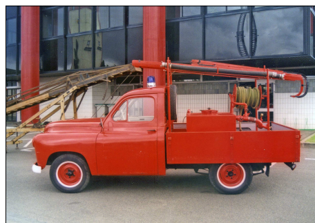
176 SP – BLOIS (41) Premier Secours (non normalisé) Renault Prairie.