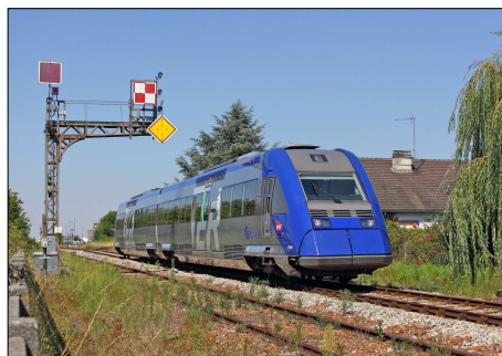
852 CF – CHÂTEAUDUN (28) Autorail X 72669/ 670 se dirige vers Cloyes.