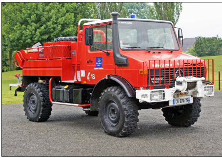
180 SP – MALESHERBES (45) Camion Citerne feux de Forêt Maheu-Labrosse sur Mercedes Unimog 1300 © Francis BOURY - 2012.