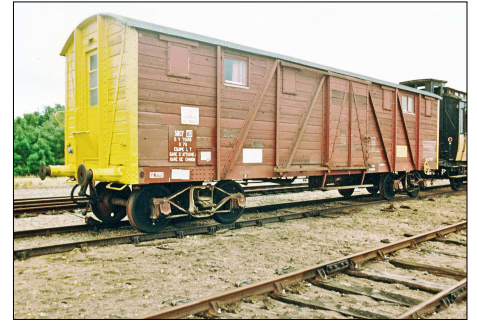
862 CF – RICHELIEU (37) Wagon couvert TP du service de la voie.