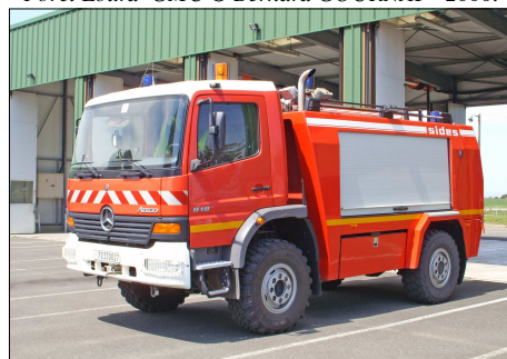
170 SP – CHÂTEAUDUN (28) Véhicule de Secours Aéronautique Sides sur Mercedes Atégo 918.