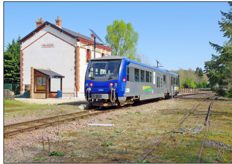
864 CF – PRUNIERIS (41) Autorail X 74501 en gare. © Pierre BAZIN – 2022.