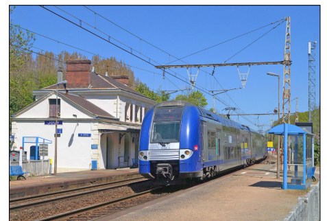
853 CF – JOUY (28) Automotrice Z 26525/526 © Daniel RICHER - 2016.