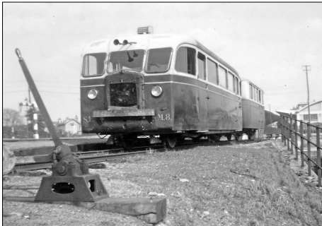
848 CF – BOURGES (18) Autorail De Dion Bouton NJ 2 n° M 8. 1946.