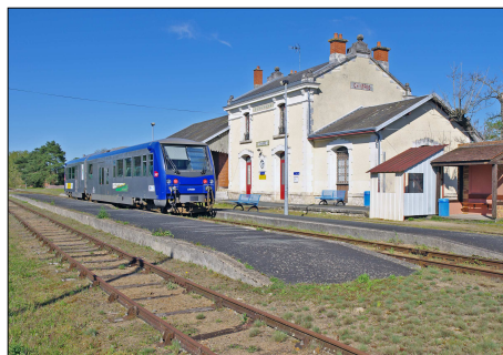
855 CF – CHABRIS (36) Autorail X 74501 en provenance de Valençay.