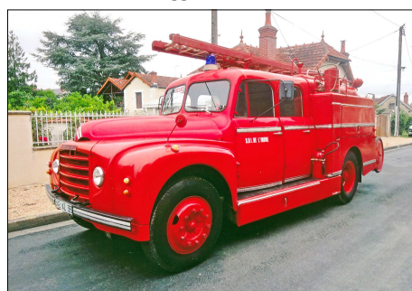
173 SP – CHABRIS (36) Fourgon Pompe Tonne Guinard Citroën 46.