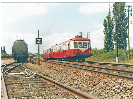
866 CF – GIEVRES (41) Autorail X 2445 en direction de Vierzon. © Daniel DUCOIN – 1981.