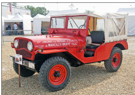
175 SP – TOURS (37) Véhicule de Liaison Hors Route VLR Delahaye © Francis BOURY - 2016.