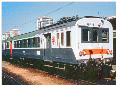
870 CF – ORLEANS (45) Automotrice Z 4100 entre Les Aubrais et Orléans.

Série "Chemin de fer Centre" : 25 CP franco de port: 29 € (France), 33 € (étranger) La carte au choix : 1,20 euro + une enveloppe timbrée à votre adresse. (1 TP jusqu'à 3 CP, 2 TP au delà) Adresser votre commande à : Alain LESAUX 1 - Le Vignery 72110 PREVELLES Règlement par chèque ou virement SEPA : BIC : CMCIFR2A IBAN : FR76 1548 9048 0300 0655 8030 486