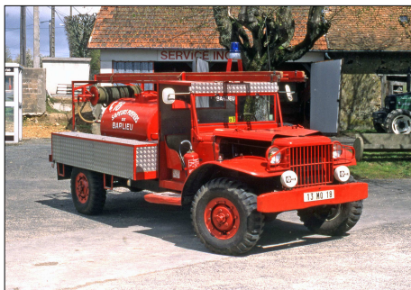
166 SP – BARLIEU (18) Camion Citerne feux de Forêt Moyen Dodge © Bernard GOURNAY - 2000.