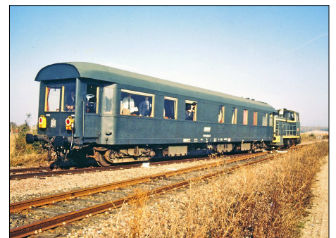
868 CF – COUDRAY (45) Locotracteur Y 7400 avec une voiture d'observation.