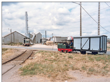
867 CF – PITHIVIERS (45) Train de travaux tracté par le locotracteur Campagne