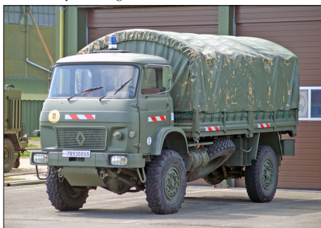
169 SP – CHÂTEAUDUN (28) Dévidoir Automobile Tout Terrain Saviem TRM 4000.