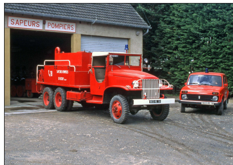
167 SP – HERRY (18) Camion Citerne feux de Forêt Lourd GMC © Bernard GOURNAY - 2000.