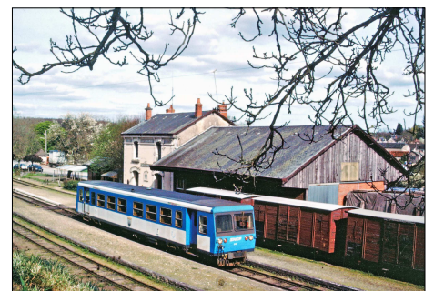
856 CF – LUCAY-LE-MÂLE (36) Autorail CFD Socofer X 242 à son terminus.