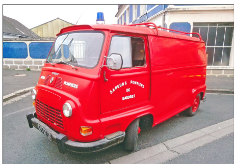
171 SP – CHABRIS (36) Véhicule Tous Usages Renault Estafette.