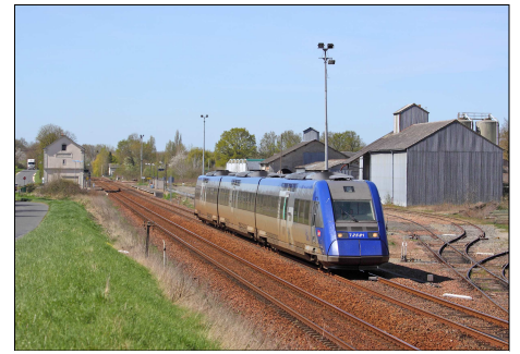
859 CF – NEUILLE-PONT-PIERRE (37) Autorail X 72581/582. © Laurent THOMAS – 2015.