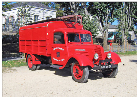
158 SP – VANNES (56) Sapeurs-Pompiers du Morbihan. Camionnette Incendie Renault AGC 3, préservée au CIS de Rochefort en Terre.