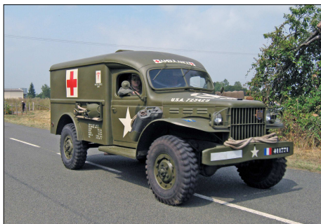
13 MIL – MEZIERES-SOUS-PONTHOUIN (72) Dodge WC 64 lors d'une commémoration des combats de la 2ème DB du Général LECLERC.