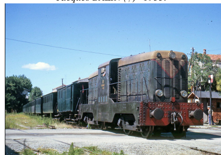
789 CF – MONTPELLIER-BIFURCATION (34) SE Hérault 1963. Ligne de Montpellier-Esplanade à Palavas-les-Flots. Le train de Palavas immortalisé par Dubout loco COFERNA n° DE 2.