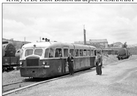
794 CF – SAINT-CHINIAN (34) SE Hérault. Ligne de Montpellier à Béziers et St- Chinian. Autorail Verney n° ZZ CC 1004 en gare. Photo Jacques BAZIN (†) – 1953.