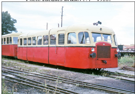
790 CF – MONTPELLIER-CHAPTAL (34) SE Hérault. Autorail Verney au dépôt. Photo Jean-Henri MANARA – 1963.