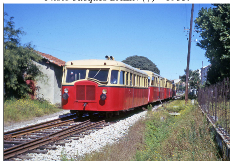
788 CF – LATTES (34) SE Hérault. Belle rame composée d'autorails Verney et De Dion-Bouton. 1963.