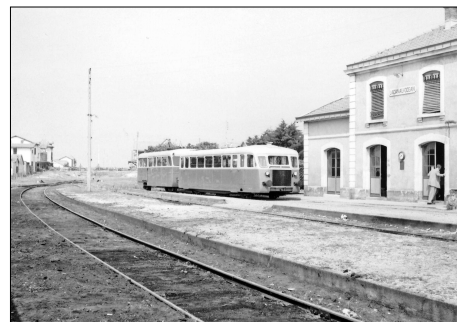
783 CF – LACANAU-OCEAN (33) SE Gironde. Ligne de Lacanau Ville à Lacanau- Océan. Autorail De Dion-Bouton M avec une remorque. Ph. J. BAZIN (†) – 1953.