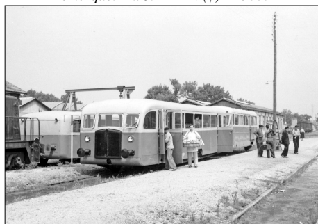
785 CF – LACANAU-VILLE (33) SE Gironde ; Ligne de Lacanau Ville à Lacanau- Océan. Autorail De Dion-Bouton Photo Jacques BAZIN (†) – 1953.