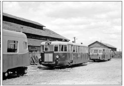
798 CF – CONNÉRRE-BEILLÉ (72)

M-St-C - Mamers Saint-Calais. Ligne de Connerré-Beillé à St-Calais. Train tracté par le locotracteur CFD n° 9. 1965.