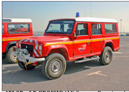
152 SP – LE CROISIC (44) Sapeurs-Pompiers de Loire-Atlantique. Voiture de Liaison Hors Route Nautique Santana PS 10 du CIS Saint-Nazaire. Photo Francis BOURY - 2009