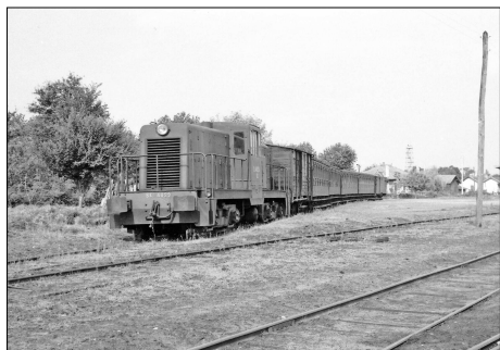
781 CF – ARÈS (33) SE Gironde. Ligne de Facture à Lacanau-Ville. Train tracté par la loco Général Electric n° 4029. Photo Jacques BAZIN (†) – 1958.