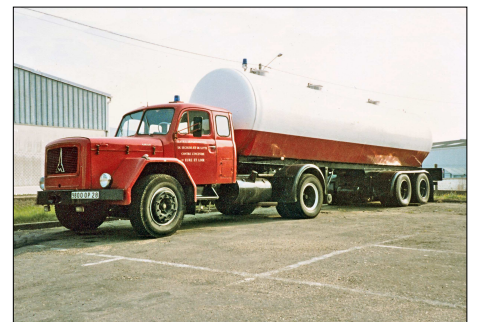
150 SP – CHARTRES (28) Sapeurs-Pompiers d'Eure et Loir. Semi-remorque citerne de grande capacité Titan, tracteur Magirus stationné à l'atelier départemental. Photo Alain LESAUX – 1980.