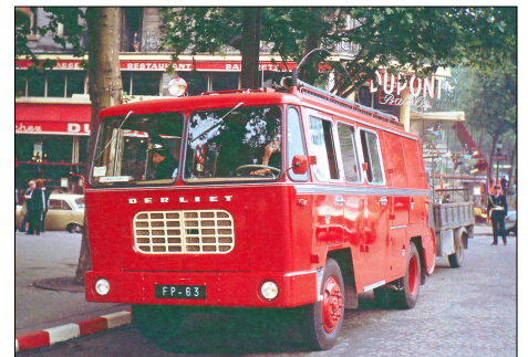
159 SP – PARIS (75) Sapeurs-Pompiers de PARIS. Fourgon Pompe Berliet GAK 17, de la caserne Chaligny place de la Bastille. 1963.