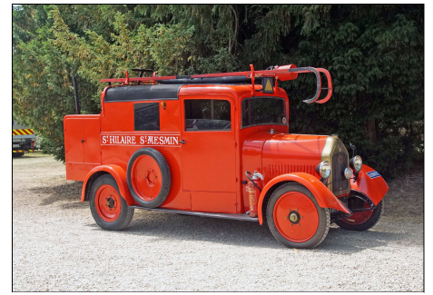
153 SP – PITHIVIERS (45) Sapeurs-Pompiers du Loiret. Camionnette d'Incendie Delaigère et Clayette type W, préservée par la commune de St-Hilaire St-Mesmin. Photo Francis BOURY - 2015.