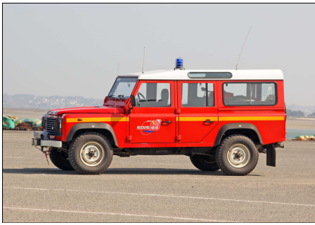
151 SP – LE CROISIC (44) Sapeurs-Pompiers de Loire-Atlantique. Voiture de Liaison Hors Route Nautique Land Rover Defender du CIS La Baule. Photo Francis BOURY - 2009.