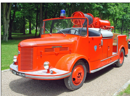
160 SP – CHAMARANDE (91) Sapeurs-Pompiers de l'Essonne. Premier Secours Pompes-Guinard H6 G54 sur Hotchkiss PL 50 préservé par « La Remise 91 ». Photo Jean-Philippe BUNOUST - 2013.