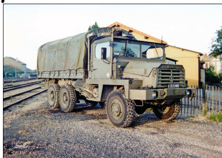
11 MIL – PITHIVIERS (45) Berliet GBC 8 KT du 5ème Régiment du Génie, lors d'un chantier école au musée des transports. Photo Alain LESAUX - 1997.