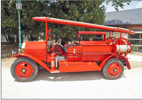
154 SP – PITHIVIERS (45) Sapeurs-Pompiers du Loiret. Camionnette d'Incendie Delaigère et Clayette type W, préservée par l'amicale des Sapeurs-Pompiers d'Olivet. 2015.