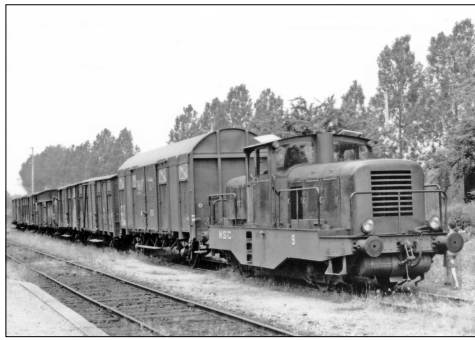
797 CF – BOULOIRE (72)

M-St-C - Mamers Saint-Calais. Ligne de Connerré-Beillé à Mamers. Train spécial tracté par la loco « Hannibal » SACM 030 T n° 6, croisant un train de marchandises Photo Jacques BAZIN (†) – 1965.