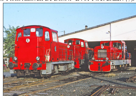
795 CF – MORCENX (40) VFL - Voies Ferrées des Landes. Les locotracteurs Y 01, BB 71003 et BB 207 stationnent au dépôt. Photo Alain DUPIRE – 1990.