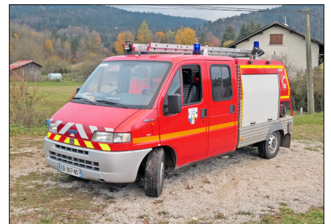
147 SP – LE POIZAT-LALLEYRIAT (01) Sapeurs-Pompiers de l'Ain. Véhicule de Première Intervention Neufoca sur Fiat Ducato. Photo Bernard GOURNAY - 2021.