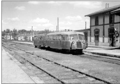
799 CF – MAMERS (72)

Commune de Beillé. M-St-C - Mamers Saint-Calais. Autorails Renault VG et Billard A 75 D. Photo Jacques BAZIN (†) – 1953.