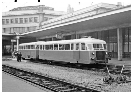
782 CF – BORDEAUX-SAINT-LOUIS (33) SE Gironde. Ligne de Bordeaux St-Louis à Lacanau- Ville. Autorail De Dion-Bouton M avec une remorque. Ph. J. BAZIN (†) – 1953.