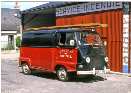
157 SP – MENIL (53) Sapeurs-Pompiers de la Mayenne. Véhicule Tout Usage Renault Estafette. Véhicule communal servant aussi de corbillard. Photo B. GOURNAY - 1998.