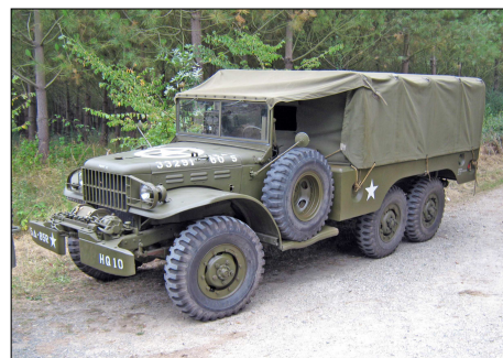
12 MIL – MEZIERES-SOUS-PONTHOUIN (72) Dodge WC 63 lors d'une commémoration des combats de la 2ème DB du Général LECLERC.