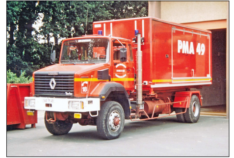
156 SP – SAINT-BARTHELEMY-D'ANJOU (49) Sapeurs-Pompiers de Maine et Loire. Cellule Poste Médical Avancé Toutenkamion sur porteur Renault 4x4 à la caserne d'Angers Chêne vert.