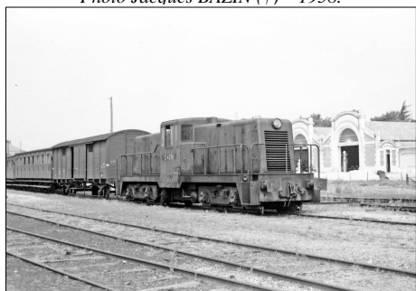
784 CF – LACANAU-OCEAN (33) SE Gironde. Ligne de Lacanau Ville à Lacanau- Océan. Train tracté par la loco GE n° 4036. 1953.