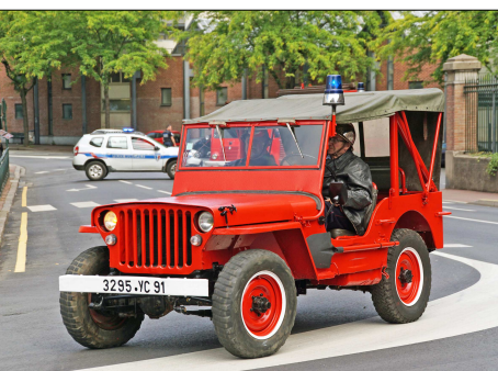
164 SP – CORBEIL-ESSONNE (91) Sapeurs-Pompiers de l'Essonne. Voiture de Liaison Hors Route Willys MB « jeep », préservée par l'association « La Remise 91 ». Photo Francis BOURY - 2019.

Série "Sapeurs-Pompiers" : 20 CP franco de port: 24 € (France), 28 € (étranger) La carte au choix : 1,20 euro + une enveloppe timbrée à votre adresse. (1 TP jusqu'à 3 CP, 2 TP au delà) Adresser votre commande à : Alain LESAUX 1 - Le Vignery 72110 PREVELLES Règlement par chèque ou virement SEPA : BIC : CMCIFR2A IBAN : FR76 1548 9048 0300 0655 8030 486