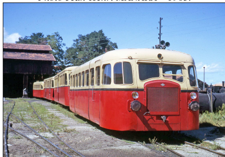
791 CF – MONTPELLIER-CHAPTAL (34) SE Hérault 1963. Belle rame composée d'autorails Verney et De Dion-Bouton au dépôt.