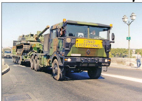
10 MIL – ORLEANS (45) Transport d'un char Leclerc sur une remorque Lorh tracté par un Renault TRM 700-100. 1997.