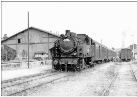
796 CF – BONNETABLE (72)

M-St-C - Mamers Saint-Calais. Ligne de Connerré-Beillé à Mamers. Train spécial tracté par la loco « Hannibal » SACM 030 T n° 6, croisant un train de marchandises Photo Jacques BAZIN (†) – 1965.