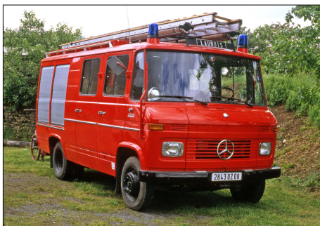
148 SP – LAUNOIS-SUR-VENCE (08) Sapeurs-Pompiers des Ardennes. Véhicule d'extinction Rosenbauer LF8 (Löschfahrzeug 800 l/min) sur Mercedes 408. Photo Bernard GOURNAY - 1992.