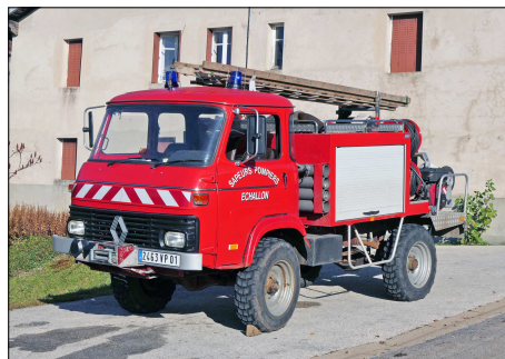
146 SP – ECHALLON (01) Sapeurs-Pompiers de l'Ain. Camion-citerne de 1 ère intervention Neufoca sur Saviem TP 3. Photo Bernard GOURNAY - 2021.