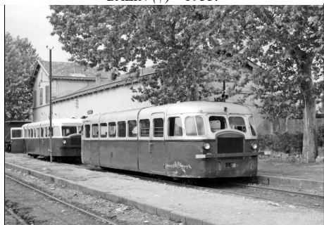
787 CF – BÉZIERS-NORD (34) SE Hérault. Ligne de Montpellier à Béziers et St- Chinian. Autorails Verney en gare. Photo Jacques BAZIN (†) – 1953.