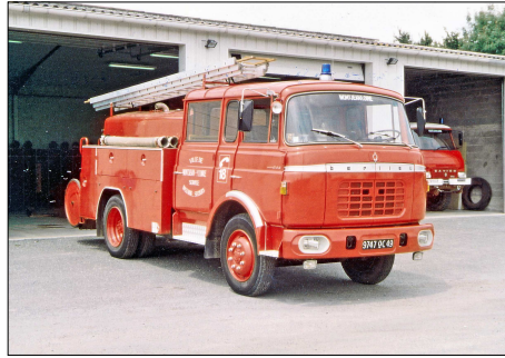
155 SP – MONTJEAN-SUR-LOIRE (49) Sapeurs-Pompiers de Maine et Loire. Fourgon Pompe Tonne Berliet GAK 20 H. Photo B. GOURNAY – 2000.