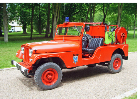
AP 162 SP – CHAMARANDE (91) Sapeurs-Pompiers de l'Essonne. CCF léger haute pression AMC Jeep CJ 6 préservé par l'association « La remise 91 ». Photo Jean-Philippe BUNOUST - 2013.