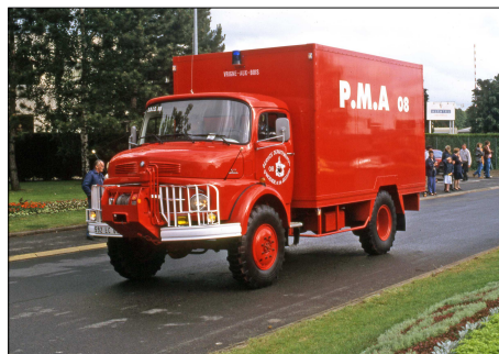
149 SP – VRIGNE-AUX-BOIS (08) Sapeurs-Pompiers des Ardennes. Poste Médical Avancé sur Mercedes LAF 911. Photo Bernard GOURNAY - 2001.