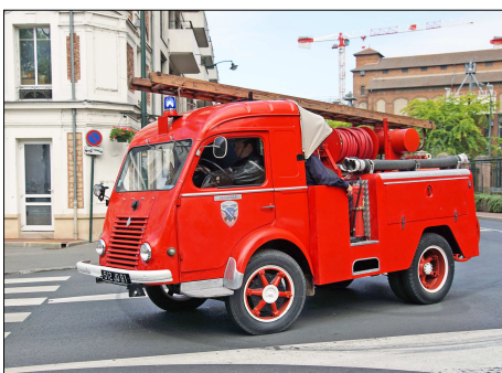
163 SP – CORBEIL-ESSONNE (91) Sapeurs-Pompiers de l'Essonne. Premier Secours Léger Drouville sur Renault Galion préservé par l'association « La Remise 91 »