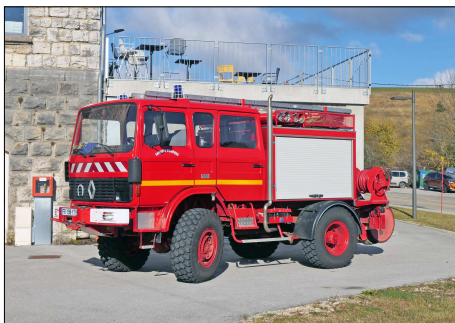
145 SP – BELLELDUOX (01) Sapeurs-Pompiers de l'Ain. Véhicule de Première Intervention Lourde Hors Route sur Renault VI. Photo Bernard GOURNAY - 2021.