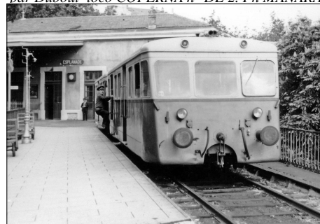
792 CF – MONTPELLIER-ESPLANADE (34) SE Hérault. Ligne de Montpellier-Esplanade à Palavas- les-Flots. Autorail De Dion n° Z 701.