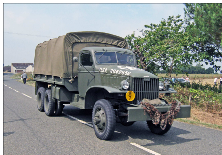
14 MIL – MEZIERES-SOUS-PONTHOUIN (72) GMC CCKW 353 lors d'une commémoration des combats de la 2ème DB du Général LECLERC.

Série "véhicules militaires" 5 CP franco de port: 7 € (France), 8 € (étranger),