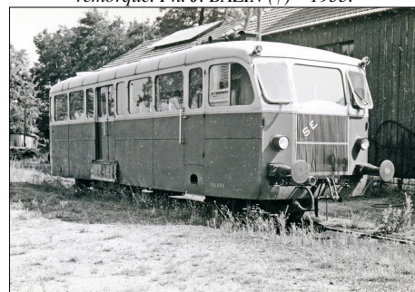
786 CF – SAINT-CIERS-SUR-GIRONDE (33) SE Gironde. Ligne de St-André-de-Cubzac à St-Ciers- sur-Gironde. Autorail Renault TE n° MX 205. Photo Jacques BAZIN (†) – 1955.