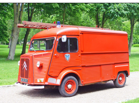
161 SP – CHAMARANDE (91) Sapeurs-Pompiers de l'Essonne. Véhicule Tout Usage Citroën H préservé par l'association « La remise 91 ». Photo Jean-Philippe BUNOUST - 2013